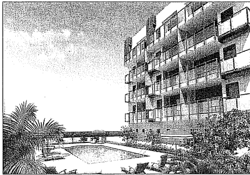
Promoción Serenna, en Bellreguard (Valencia), de Primer Grupo. EL BOLETÍN