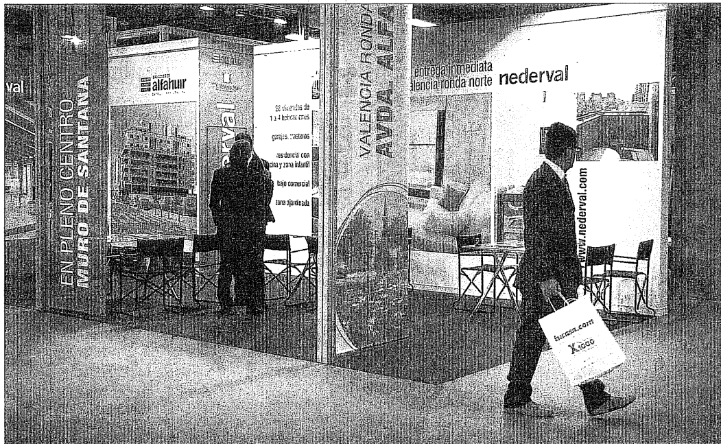
La jornada inaugural de la feria inmobiliaria Urbe presentó ayer una escasa asistencia de clientes.