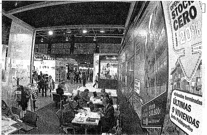
Panorámica de la feria Urbe Desarrollo que finaliza hoy en Feria Valencia