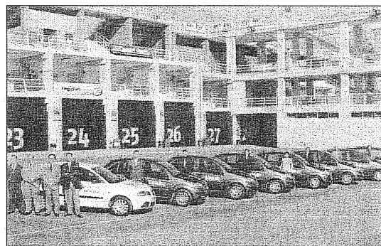
ENTREGA EN CHESTRE. Nueve coches rotulados para los franquiciados.

Desde el inicio de su actividad en 1988, Primer Grupo Corporación Inmobiliaria se ha convertido en un referente dentro del sector, siendo la única empresa capaz de ofrecer la garantía que supone su participación directa en todas las etapas del proceso inmobiliario, desde la elaboración del concepto mismo de la promoción, hasta la venta final de los inmuebles.