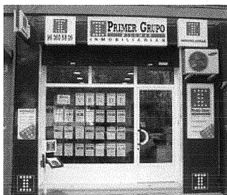
La compañía mantiene operativos más de 40 establecimientos en España

La cadena de franquicias que opera en el sector inmobiliario ha presentado esta mañana, aprovechando la celebración de su Convención Anual, las previsiones de cierre del presente ejercicio que reflejan una cifra de negocio que alcanzará los 44 millones de euros.